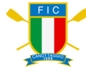
FEDERAZIONE ITALIANA CANOTTAGGIO