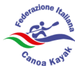
FEDERAZIONE ITALIANA CANOA KAYAK