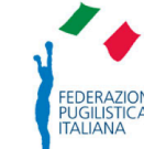
FEDERAZIONE PUGILISTICA ITALIANA