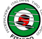
FEDERAZIONE ITALIANA TIRO CON L'ARCO