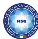
FEDERAZIONE ITALIANA SPORT DEL GHIACCIO