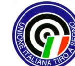
UNIONE ITALIANA TIRO A SEGNO