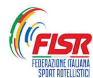
FEDERAZIONE ITALIANA SPORT ROTELLISTICI