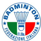
FEDERAZIONE ITALIANA BADMINTON