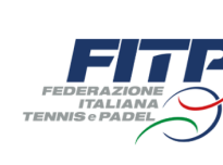
FEDERAZIONE ITALIANA TENNIS E PADEL